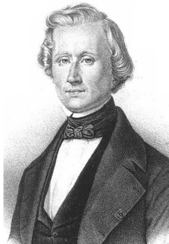
Urbain Le Verrier

Le Verrier sai paugupealt kuulsaks, Adamsi tööd aga teadsid vaid Airy, Challis, Herschel ja mõned Adamsi sõbrad. Esimene Adamsi nime avalik mainimine toimus 3. oktoobril, kui Sir J. Herschel avaldas kirja „Le Verrier'i planeet“ ajakirjas Athenaeum. Sellele järgnes Challise kiri samas ajakirjas 17. oktoobril, kus Challis kirjeldas Adamsi tööd. Siis sai ka teatavaks, et Adamsi järeldused olid Challisele ja Airyle teada juba 1845. aastast saadik ja et Challis tegelikult uut planeeti otsis. Paljud imestasid ka, et Adams ei avaldanud otsekohe oma töö tulemusi.