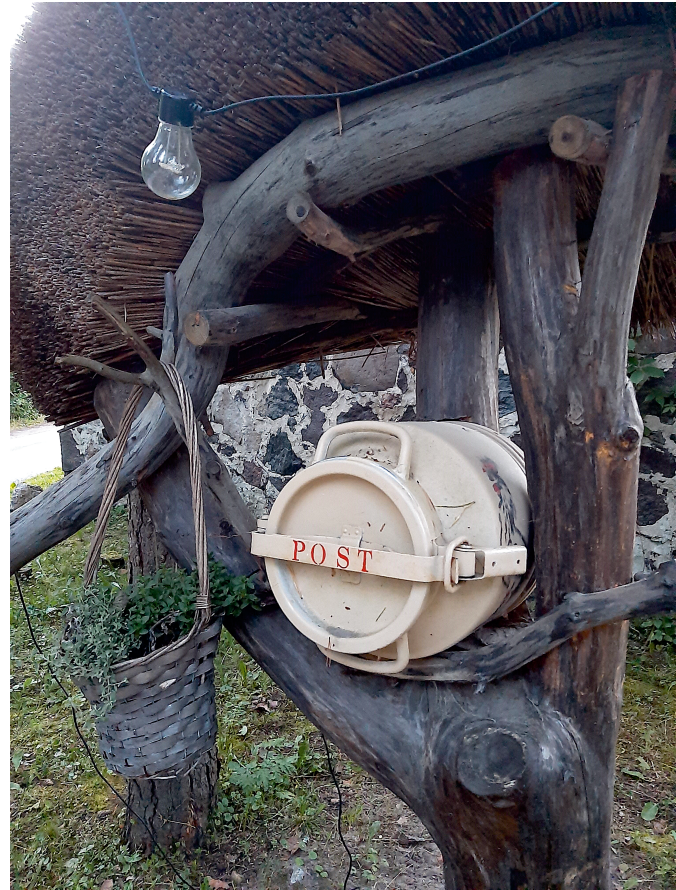
Postkasti asemel on mõnikord ka piimamannerg või ämber ...