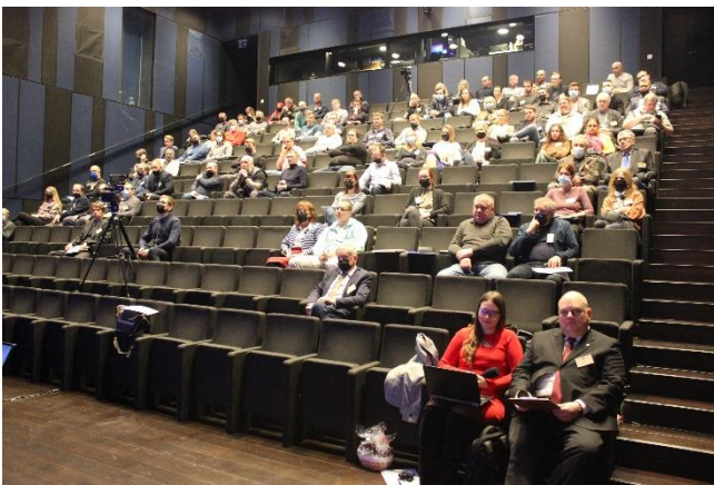
EGÜ Kevadkonverents 2022 Eesti Rahva Muuseumis.